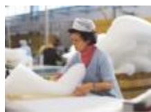
硬凸軟凹の絶妙な寝心地は職人の手仕事から生まれる。