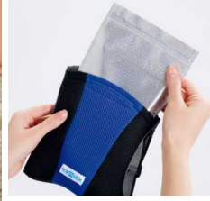
アルミパック入りの凍らせた強化保冷剤を収納する。

本品はリュックの中に入れる保冷剤が進化。メーカー従来品の「150g 2個組」から溶けにくい「300g 1個」に大型化しました。これに太陽熱を反射するアルミシートを二重に重ねて収納するので、