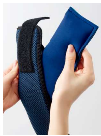
クロロプレンゴムに封入した冷却ジェルを凍らせて使う。

(約)縦9×横45×厚さ3cm、重さ約270g、素材:ネックポケット/ポリエステル、保冷剤/クロロプレンゴム・水不凍液・ゲル化剤、冷却持続時間目安:約2時間、 日本製 ※カバーは洗濯機で弱水流ネット洗い。