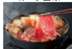
全内容写った真上画像