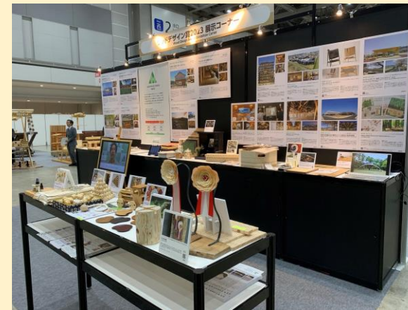
モクコレ2025@東京ビッグサイト 2024年12月19, 20日 ウッドデザイン賞展示・企画展示