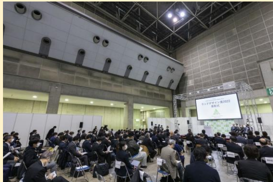
エコプロ2024表彰式、展示、セミナー @東京ビッグサイト 2024年12月4～6日