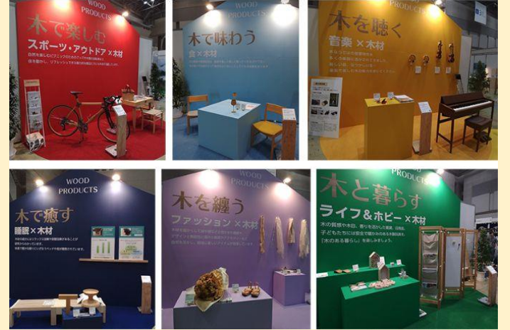
Japan ReWood @東京ビッグサイト 2024年8月17, 18日 ウッドデザイン賞作品の展示