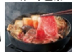
全内容写った真上画像