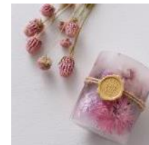
キャンドルづくり