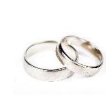
シルバーリングづくり