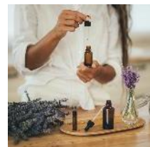
アロマオイルづくり