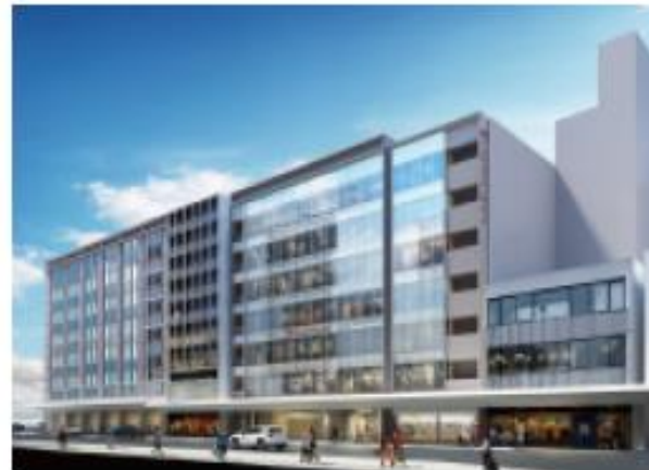
京都高島屋 S.C. [T8] 2階