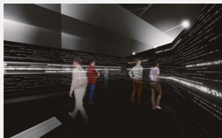
1. 万博会場掲出エリアイメージ